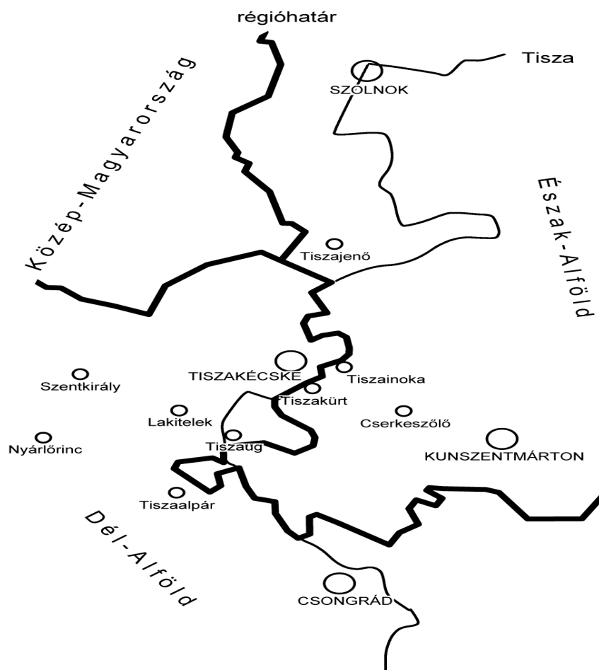
1. ábra. A vizsgált térség és a kettős határsávon elhelyezkedő települései

A kistérségi régiós és megyehatárok esetében is megvan a kettős határvonal-funkció. Ezek elsősorban elválasztó szerepet kaptak az utóbbi évtizedekben, de egyúttal lehetőséget is teremtettek az országon belüli „határvidékeknek” a közeledésre. Az ökológiai tengely, mint természetes, a közigazgatási beosztás pedig, mint mesterséges “limes” tehát kétféleképp hathat az itteni települési közösségekre. A határvonalak egyrészt a városok, falvak településcsoporttá való formálódásában, ugyanakkor elkülönülésében, országon és egymáson belül viszonyított periferizálásában játszanak szerepet. Feltételezzük, hogy a vizsgált természetföldrajzi és régióhatárokkal elválasztott településcsoport, történelmi, társadalom-földrajzi és néprajzi szempontok szerint hasonló jellegű, tehát specifikus alföldi tér, mely ráadásul – részben ez utóbbi kettősség miatt – bizonytalan jövő előtt áll.