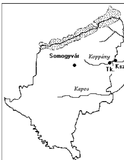
2. ábra. Koppány főbb szálláshelyei (Tk = Törökkoppány, Ksz = Koppányszántó)

Géza Zerind halála után a riválisként számító Koppánynak nem a gazdagabb és hagyományosan adományozandó bihar-aldunai vagy nyitrai részt adta dukátusul, hanem a somogyi térséget. Ez a terület az Árpád-korban jóval nagyobb volt, mint napjainkban. Hozzá tartoztak a Dráván-túli részek is, egészen a Száváig. A területet hatalmas erdőségek, nagy kiterjedésű nedves térszínek foglalták el, szláv ajkú lakossága igen gyér volt. Koppány nem a hajdani fejedelmi szálláshely környékén alakította ki udvarházát, hanem attól keletre, egy folyócska mentén, amely ma is a Koppány nevet viseli. Az egykori udvarházra napjainkban Törökkoppány és Koppányszántó települések is utalnak. Utóbbi ma Tolna megyében található. Törökkoppány csak a középkor során tartozott Tolnához, azóta Somogy megye része. Vezéri székhelyül a már Fajsz idején emelt somogyvári várat tette meg és kora egyik legnagyobb erősségévé fejlesztette.