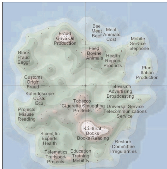
Az információs tér szemantikai ábrázolása