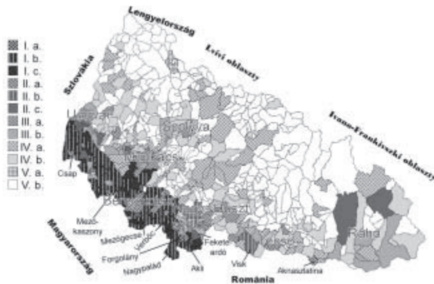
2. ábra A magyarok és az Magyarországra áttelepültek aránya Kárpátalja településein (2001) I. magyar többségű települések (50–100%): a – jelentős arányú áttelepüléssel és jelentős áttelepülés miatti fogyással; b – jelentős arányú áttelepüléssel; c – nem jelentős áttelepüléssel; II. magyar kisebbséggel rendelkező települések (10–50%): a – jelentős arányú áttelepüléssel és jelentős áttelepülés miatti fogyással; b – jelentős arányú áttelepüléssel; c – nem jelentős áttelepüléssel; III. szóránymagyarság (1–10%): a – a jelentős áttelepülés miatt megszűnőben; b – nem jelentős áttelepülés; IV. magyar előfordulás (1% alatt): a – jelentős áttelepülés miatt megszűnőben; b – nem jelentős áttelepülés; V. magyar népesség nélküli települések: a – van kitelepülés; b – nincs kitelepülés

Sajátosságként megemlítendő, hogy emellett vannak olyan kizárólag ruszinok (ukránok) lakta kisebb települések is, mint Perekraszna (volóci járás), vagy Oroszkucsova (munkácsi járás), amelyek lakosságuk 4–6%-át veszítették el a Magyarországra való átköltözéssel.